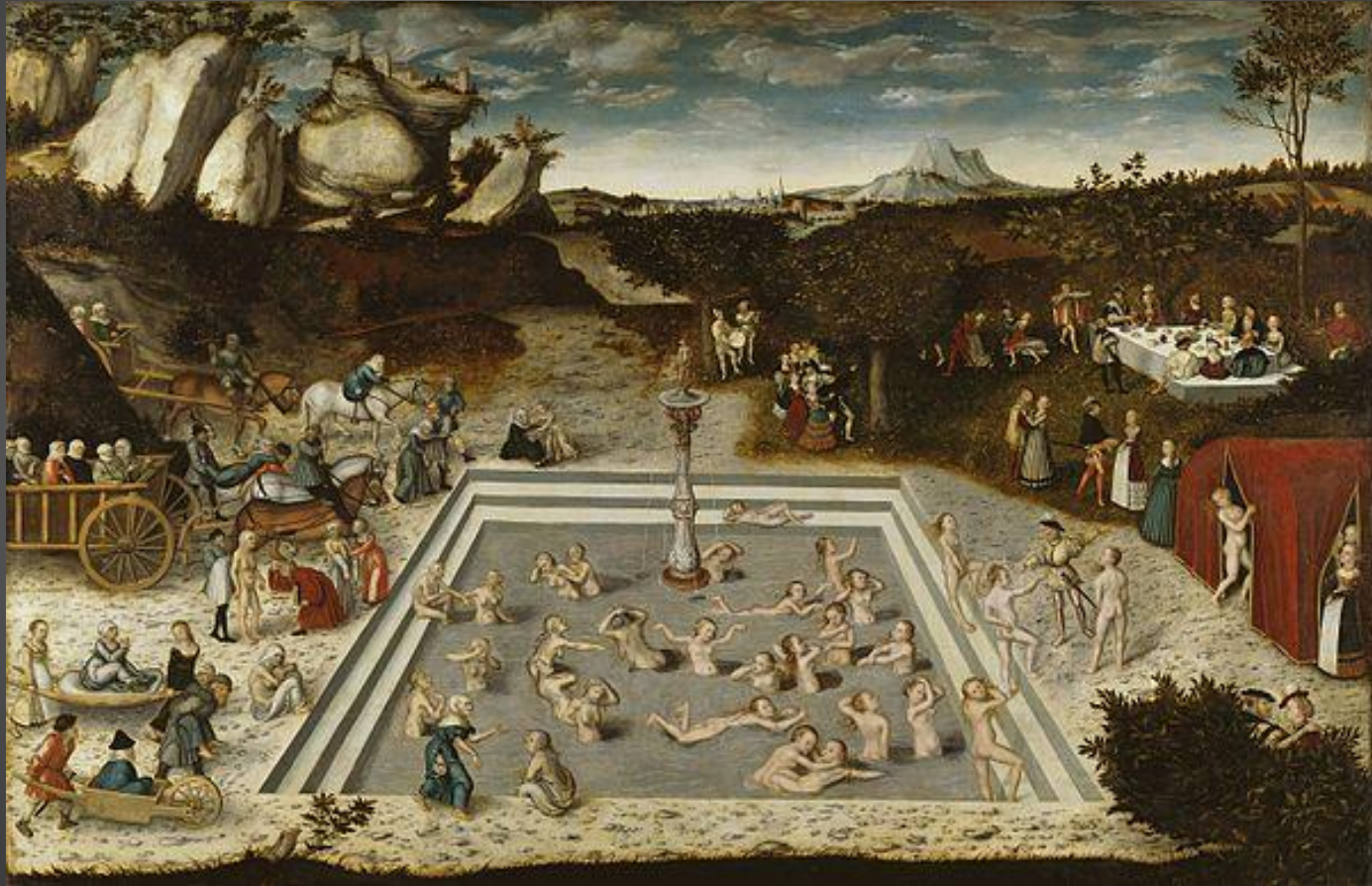
Lukas Cranach 1546: Jungbrunnen